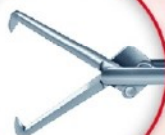
PINZAS DE AGARRE PARA EXTRACCION DE PIEDRAS

DESMTABLE ESTÁNDAR - DESMTABLE CON CANAL DE LIMPIEZA