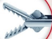
PINZAS COCODRILO PARA HISTEROSCOPIAS